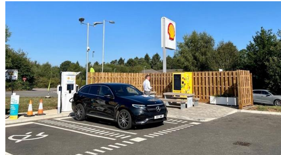
Image: Shell UK EV recharge station and Mars Smart Vending solution

Paiement facile, plusieurs options de paiement