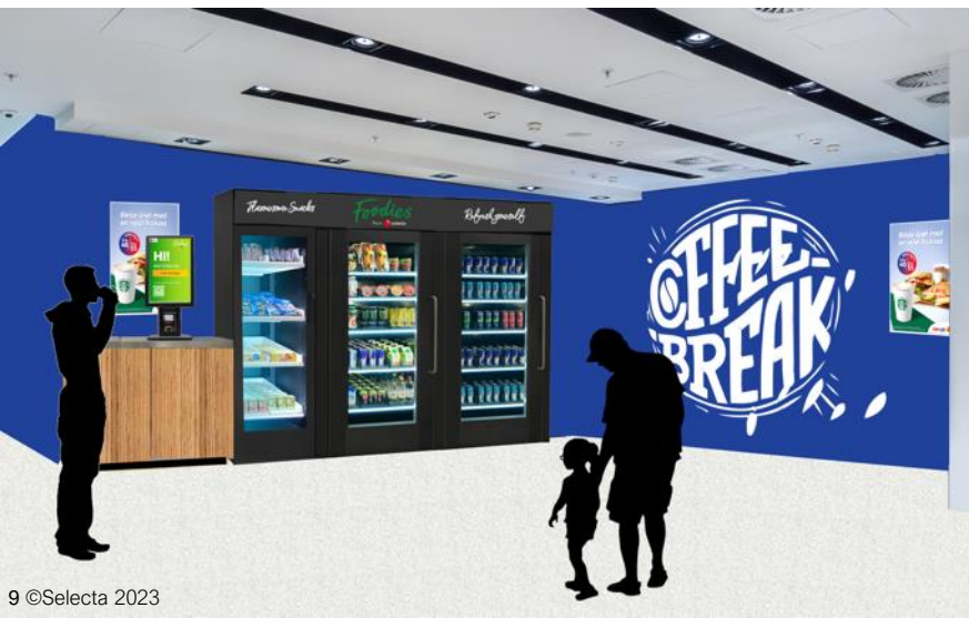
Image: Foodies Grab & Go, Lounge set-up: Smart Fridges ambient & cold food items

Le concept Foodies prend différentes formes, allant d'un Food Market à un Smart Fridges : Foodies Grab & Go et une véritable solution de magasin. Pour les petits sites, un seul Smart Fridge peut être utilisé, où pour les endroits plus bondés comme les zones de toilette, le soi-disant Lounge est parfaitement adapté car il vous permet d'offrir de la nourriture et des boissons pendant que les gens attendent et errent, ainsi que des produits non alimentaires essentiels.