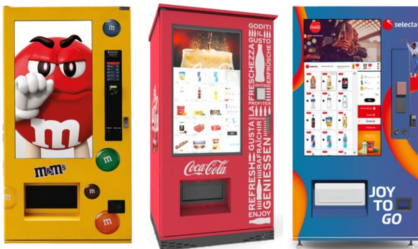
Image: Selecta Smart Vending solutions. From left to right: Supplier funded Mars & Cocoa-Cola, Selecta Joy To Go