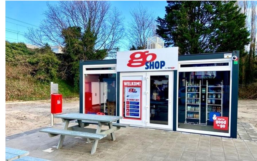
Image: Go shop by Tango, Foodies container store, NL

Les heures prolongées, la disponibilité 24h / 24 et 7j / 7, les caisses rapides et les emplacements facilement accessibles ajoutent de la valeur pour les voyageurs, les navetteurs, tout le monde.