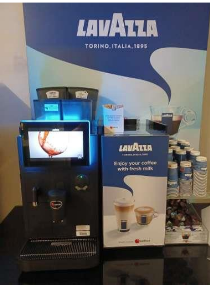
Image: Lavazza solution

Offre d'une gamme de boissons leader de l'industrie, y compris la gamme de base classique, comme l'espresso et le cappuccino, ainsi que des boissons glacées, thé, alternatives à base de plantes, et sirops de café. Nous voulons nous assurer que la présentation dans votre magasin C est aussi holistique que possible.