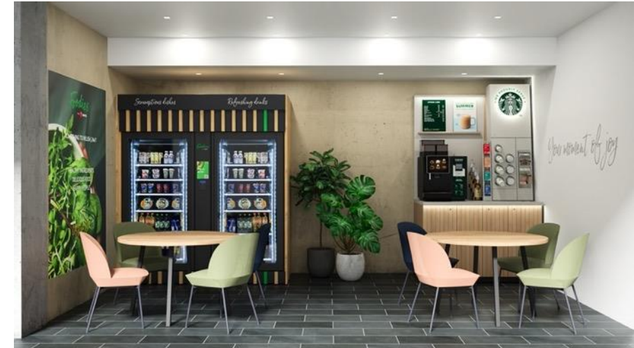
Image: from left to right. Foodies Grab & Go, Smart Fridge. Starbucks Coffee Corner

D'environ 30 compartiments de produits par Smart Fridge, les gens peuvent sélectionner leurs marchandises ou aussi retourner des articles qui ont déjà été retirés après vérification. La technologie de pointe intelligente détecte si un article a été retiré et affiche la sélection choisie à l'écran. Lors de la fermeture de la porte, le logiciel de la machine ne calcule que les produits qui ont été pris.